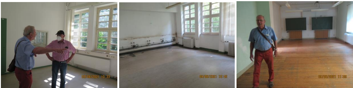
Unterrichts- und Prüfungsräume

Eine Reihe verschiedener Exponate aus der aktiven Seefahrtsschulzeit befinden sich noch im Gebäude.