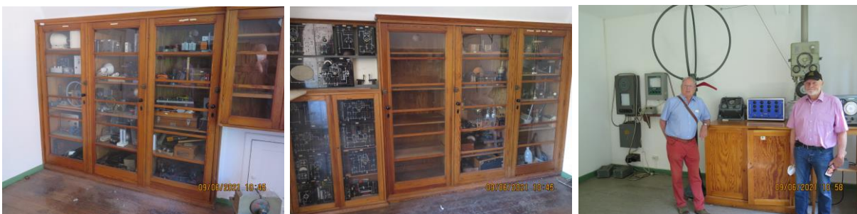
Gerätschaften wie Peilrahmen, Echograph etc....

Eine Reihe verschiedener Exponate aus der aktiven Seefahrtsschulzeit befinden sich noch im Gebäude.