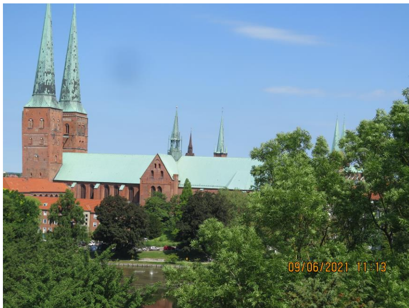
Blick vom Dachboden der Seefahrtsschule auf den Dom

Wir baten daraufhin, zu prüfen, ob ggf. diese Räumlichkeiten für ein kleines Museum zur Thematik „Seefahrtsschule Lübeck / maritime Exponate“ vorgesehen werden könnte. Diese Frage wird derzeit geprüft und wir erhoffen uns eine baldige Antwort. Vorstellbar wäre, dass ein solches Museum dann für Besuche auf Anmeldung zugänglich wäre und von Mitgliedern des NVL ehrenamtlich betreut würde.