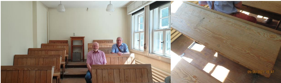
Physikraum (u.a. mit Schnitzereien von Generationen von Seefahrtsschülern auf den Tischen...)